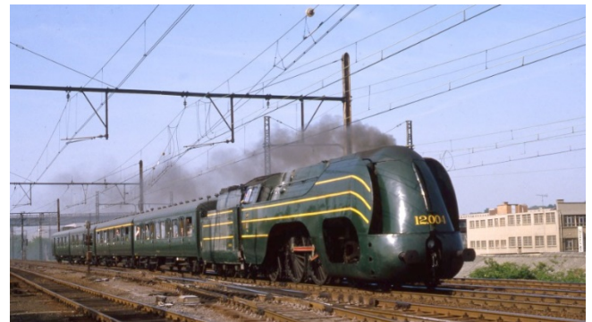
Locomotive à vapeur 12.004 lors d'une parcours historique le 26 mai 1985 (Réf. M380_001)