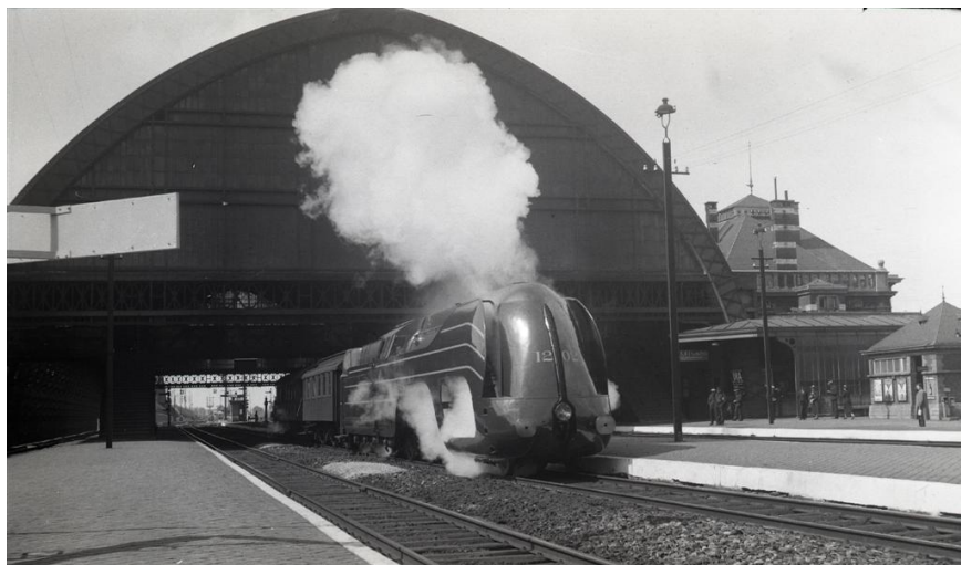
Locomotive à vapeur 1202 avec tender à Malines, 1939 (Réf. Q0103)

Le précédent record était détenu par une société de chemins de fer américaine, la « Chicago, Milwaukee, St-Paul and Pacific R.R. », avec une vitesse moyenne de 119,8 km. Le record n'a tenu que quelques mois dans notre pays, et retournera début 1940 à la société américaine, pour une vitesse moyenne de 121,8 km/h avec le « Hiawatha ».