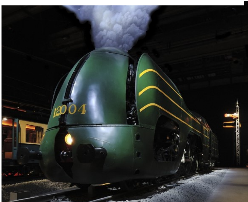
Locomotive à vapeur 12.004 dans le Hall 2 de Train World (Réf. D4094-03)