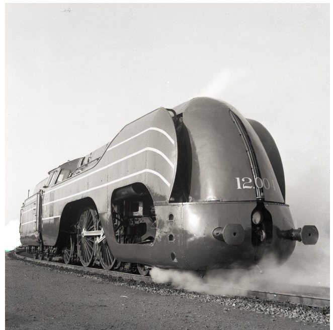
Locomotive à vapeur type 12 (Réf. Z02268B)

Leur fuselage aérodynamique a été conçu par l'ingénieur français Huet qui l'installe également sur des locomotives des chemins de fer français. Il est composé d'un bouclier frontal, fendu en son milieu, assurant une déviation optimale de l'air lors de