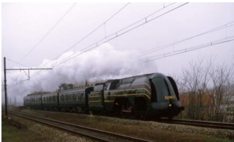
Parcours vapeur historique du 11 mai 1985 (Réf. M381_032)

Aujourd'hui, la 12.004 est la pièce maîtresse de Train World.